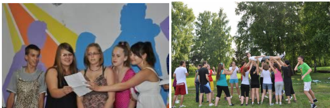
Animations culturelles et sportives au camp linguistique

A côté des cours de langue, le camp est la plus importante initiative du Centre F-P au niveau de la popularisation de langue française. Nous allons reconduire cette initiative l'année prochaine, cette fois en coopération avec l'association Amitié.