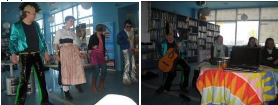
Le jeu sur le cinéma européen organisé par les volontaires

Chaque semaine, le volontaire animait des discussions consacrées aux problèmes politiques actuels, comme le Printemps arabe en Tunisie et en Egypte ou la situation des DOM-TOM. Il donnait des cours d'échecs aux enfants de l'école maternelle La Fontaine d'Olsztyn et réalisait des projets avec d'autres volontaires séjournant à Olsztyn : il a participé à un séminaire concernant le programme SVE, ainsi qu'à une animation sur le cinéma européen réalisée sous forme d'un jeu télévisé à la bibliothèque Planeta 11. Le volontaire a aussi travaillé avec l'assistante de français : ils ont animé ensemble des activités de français pour les élèves.