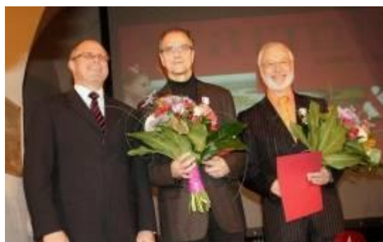
Mérites pour la Warmie et Mazurie

Le 2 novembre , au Centre Franco-Polonais, nous avons ouvert le vernissage de l'exposition photographique « En Bretagne » de Michał Kielas et, en même temps, les Journées de la Bretagne – Côtes d'Armor. Cette manifestation cyclique et annuelle était cette année entièrement consacrée à notre partenaire costarmoricain, dans le cadre de l'anniversaire de la coopération.