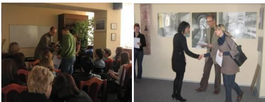
Remise de prix aux concours liés à la langue et à la culture française

Le 16 avril , au Centre Franco-Polonais, tous les participants des concours liés à la langue et à la culture française proposés avant par le Centre : orthographique, plastique et de traduction, se sont retrouvés au Centre F-P pour la remise de prix.