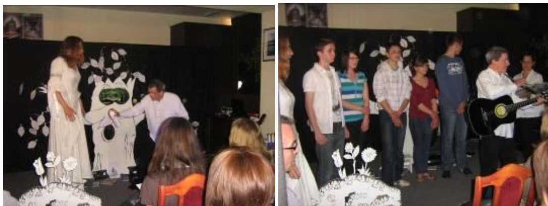
Spectacle « Petits chemins et grand voyages » au Centre Franco-Polonais

Nous avons organisé 5 spectacles au Centre F-P pour des élèves de Morağ et d'Olsztyn et un spectacle ouvert au public, qui l'a beaucoup apprécié.