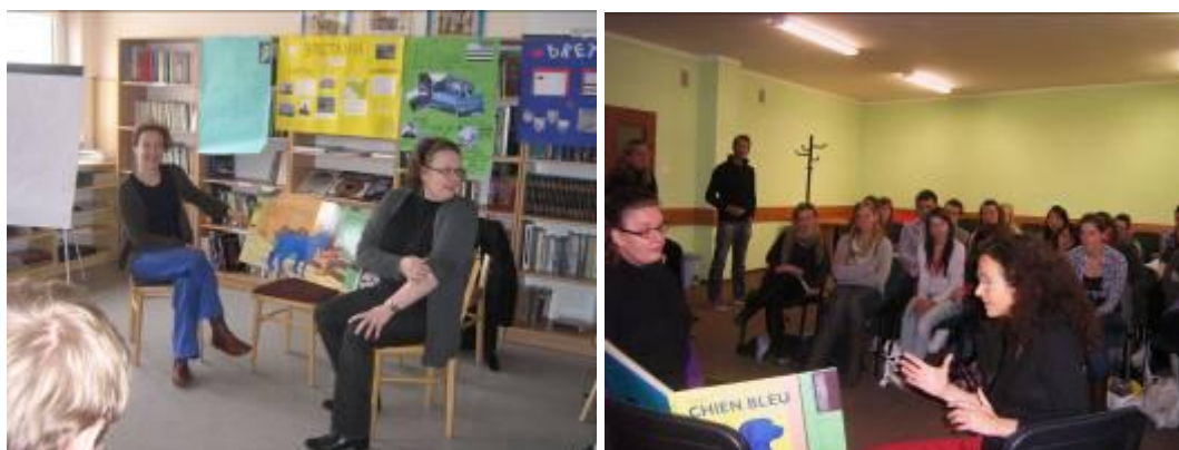
Chien Bleu au Lycée V d'Olsztyn et au lycée technique d'horticulture du paysage de Giżycko

Les artistes ont rencontré les jeunes qui apprennent le français, du lycée V d'Olsztyn et du lycée technique d'horticulture du paysage de Giżycko.