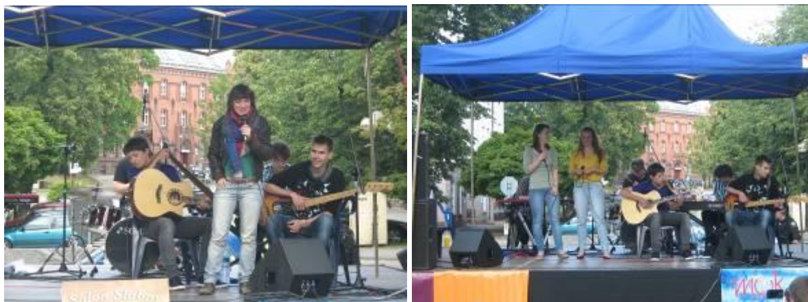
Concert de la chanson française par les élèves qui ont gagné le Concours de la Chanson Française de Nidzica

Le 26 juin , le Centre Municipal de la Culture d'Olsztyn a organisé pour la deuxième fois la Fête de la rue Dąbrowszczaków. Le Centre F-P a proposé un concert de la chanson française interprétée par les élèves qui ont gagné le concours de la chanson française de Nidzica, ainsi qu'un concert de la musique européenne par un groupe „Kapela muzyki kuchennej Jazgodki”. Pendant la fête on a diffusé des informations sur les activités du Centre et son offre linguistique.