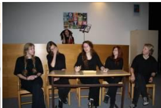
Le spectacle selon « Une Lettre » interprété par les élèves du Lycée II d'Olsztyn

Le 13 mai , dans le cadre de la semaine polonaise, une rencontre avec Frédérique Laurent, traductrice de la littérature polonaise, a eu lieu. Elle a parlé sur le travail de traducteur et a présenté une image de la littérature polonaise contemporaine.