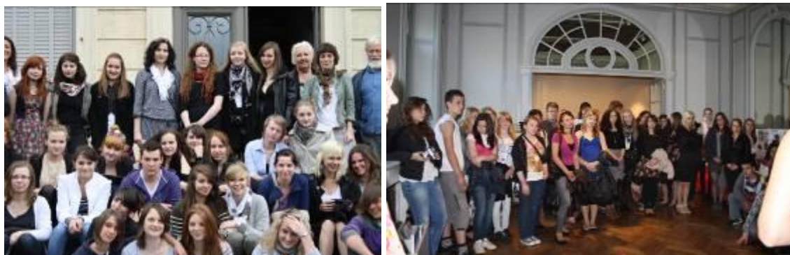
Les élèves polonais et français à la villa Rohannec'h

En mai 2011, les élèves polonais et français se sont rencontrés dans les Côtes d'Armor pour une présentation de leurs travaux. Les lycéens polonais y ont passé une semaine. La rencontre la plus importante s'est déroulée le 12 mai, à la villa Rohannec'h de Saint-Brieuc.