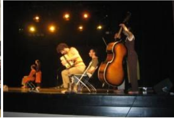
Spectacle au Centre culturel d'Ilawa

Le 19 et le 20 novembre , au Théâtre des marionnettes d'Olsztyn, la compagnie Fiat Lux a présenté le spectacle « Don Cristo Loco » de Jean-Luc Ronget fondé sur les cahiers de voyage en Amérique de Christophe Colomb.