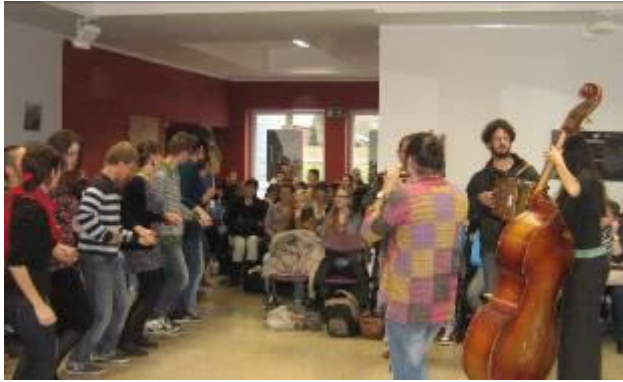
DéKoeff – rencontre avec les jeunes à Lidzbark