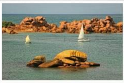
Côte de Granit Rose - Wybrzeże Różowego Granitu najpiękniejszy fragment skalistego wybrzeża Bretanii ( Côtes d'Armor)