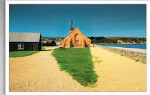
Camaret-sur-Mer – kaplica Notre-Dame-de-Rocamadour oraz zamek Vauban w kształcie wieży z końca XVII w. (Finistère)