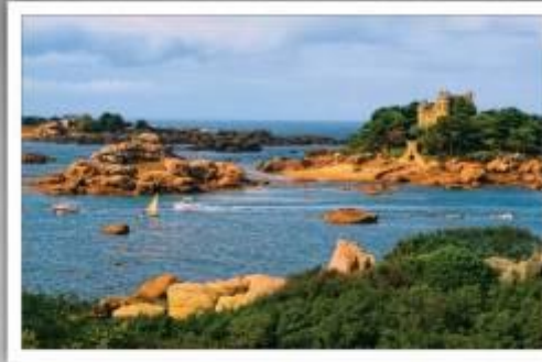
Wybrzeże Różowego Granitu – wyspa Castellis, na przełomie XIX i XX, w rękach polskiego inżyniera B. Abakoniwicza; lataj H. Sienkiewicz pisał „Rzybaków” oraz „W pustyni i pustaczy” Fort La Latte – forteca nad kanałem La Manche, m.in. wykorzystano jako dekorację do filmu „Wikingowie” (Côtes d'Armor)